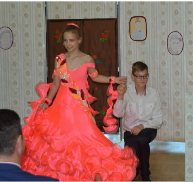
Radość i taniec